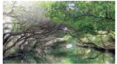
緑のトンネル(台南)