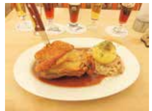
ドイツ料理の定番 豚スネ肉 (Haxe)

では、ただ単に言葉の学習だけではなく、その土台となっているドイツ語圏に生きる人々の生活・文化にも触れていきます。そうするうちに皆さんの胸の中に、ドイツ語圏へ行ってみたいとの夢が描かれることでしょう。ドイツ語を学習することによって、ドイツ語圏への旅行・語学研修・留学が現実のものになります。香川大学と交流協定を結んでいるラインマイン大学*やボン＝ライン＝ズィーク大学**への長期留学、また、ラインマイン大学での短期語学研修などが皆さんを待っています。（*経済学部、**創造工学部が交流しています。）