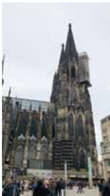
世界遺産 ケルンの大聖堂

皆さんは「ドイツ」と聞いて何を思い浮かべますか？ クラシック音楽：バッハ・ベートーヴェン、車：BMW・ベンツ・ポルシェ、飲食物：ジャガイモ・ビール・ソーセージ、サッカー：ブンデスリーガ、そして歴史上忌まわしい名前：ヒトラーなどでしょうか。ヨーロッパのちょうど中心に位置しているのがドイツ・スイス・オーストリアですが、これらの国々で公用語となっている言葉、1億人以上の人々が日常話している言葉が「ドイツ語」です。「アルバイト・メルヘン・リュックサック・バウムクーヘン・テーマ」など、皆さんが日頃目にしたり聞いたりしているこれらの言葉も実はドイツ語が語源なのです。他にも意外なところにドイツ語から借用した語彙が日本語にはたくさんあります。ドイツ