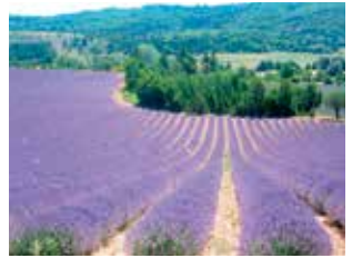
プロヴァンス地方の ラベンダー畑

フランス語は音楽のように美しいことばで、文法も整然とした規則があり、とても分かりやすい言語です。授業の初めにいくつかの発音の規則さえ覚えてしまえば、意味が分からなくても、フランス語をきれいに読めるようになります。フランス語の楽しさは、それだけではありません。フランス語は、世界中の国から選手が集まるオリンピックや、国連総会・安全保障理事会の公式言語です。また、フランス語が話されている国は、フランスだけではなく、