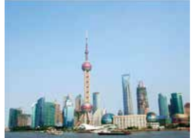
上海市:東方明珠電視塔 (オリエンタルパールタワー)

6月から中国語の特別クラスに参加し留学資格相当の検定試験合格を目標に自習プログラムを含むトレーニングを受けます。また3月には中国語圏での短期研修プログラム(要研修参加費)が提供されます。2年次前期までにHSK4級合格を目指します。