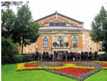
ワーグナーの聖地 バイロイト祝祭劇場

語を勉強すると、さまざまなところで近代日本の学術・文化にドイツ語圏の国々が大きな影響を与えていることに気づかされるでしょう。ドイツ語は、皆さんが高校までに学習してきた英語とは近縁関係にあり、文の構造や語彙によく似たところがたくさんあります。例として、Guten Morgen! - Good morning! や Ich bin Student. - I am a student. という表現やApfel - apple、Salz - salt、Brot - breadという語彙を挙げておきましょう。どうですか、似ているでしょう？ 「ドイツ語はむずかしい」とよく言われていますが、そんなことはありません。例えば、発音はむしろ英語よりも母音は少なく、なじみやすいものです。ドイツ語の授業