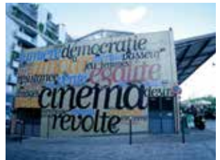
パリの映画館 フランスは映画発祥の地

段として一定の水準に達するようにカリキュラムが組まれており、学習の初歩段階に相当します。フランス語を話すときの身ぶりやフランス語圏の人々の生活、さらには映画や料理などの文化についても知識を深めながら、挨拶や自己紹介をしたり、道を尋ねたり、買い物をするといった実際に使える表現を中心に学んでいきましょう。この初歩段階の学習により、「実用フランス語技能検定」3級、フランス政府が日本をはじめ全世界で行っているフランス語資格試験「DELF」A1の取得が期待できます。教室での学習を効果的に行うためには、まず